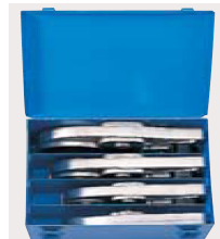
大口径ダイスセット