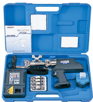
小・中口径メタキュット工具一式