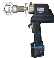
小・中口径用電動圧縮工具