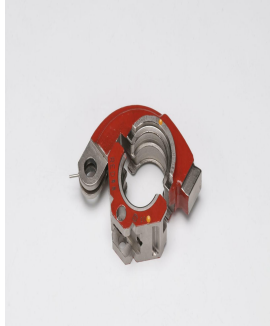
メタキュットレッド専用ダイス