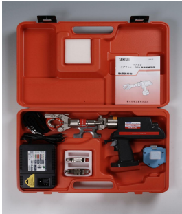
メタキュットレッド工具一式