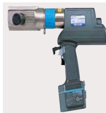
大口径用電動圧縮工具