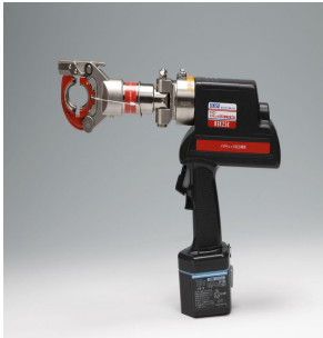
メタキュットレッド電動圧縮工具